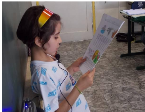
Figura 4 - Aluna lendo, para os colegas e professoras, a pesquisa sobre pombas.

Posteriormente os alunos fizeram registros por meio de desenho e/ou escrita, individuais e/ou coletivos, sobre as descobertas.